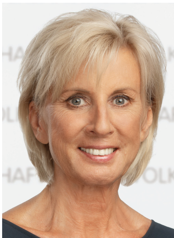
Gaby Schwarz Volksanwältin